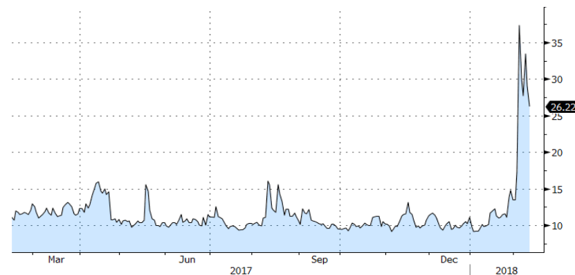
VIX SPX VOLATILITY INDEX - 1 Y

En cuanto al crudo, destacamos el Brent que perdió los niveles de 64$/barril ante las noticias de mayor producción en EEUU y los recortes de producción por parte de Irán.